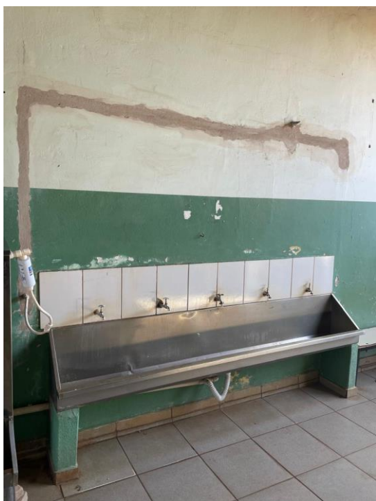
Figura 5 - Paredes com descascamento e desgaste