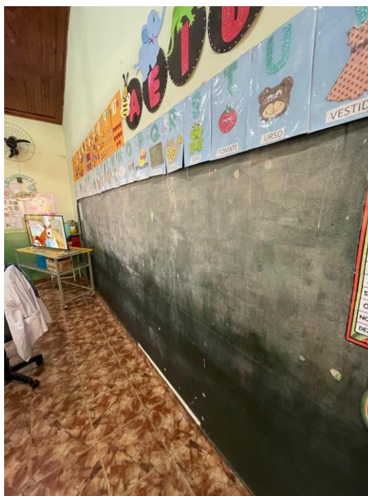
Figura 18 - Lousa deteriorada e imprópria para uso