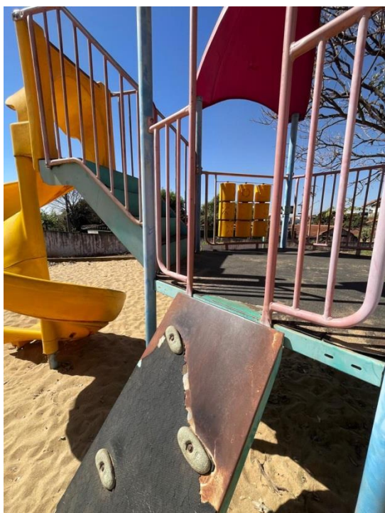
Figura 21 - Parque sem manutenção e impróprio para uso dos alunos