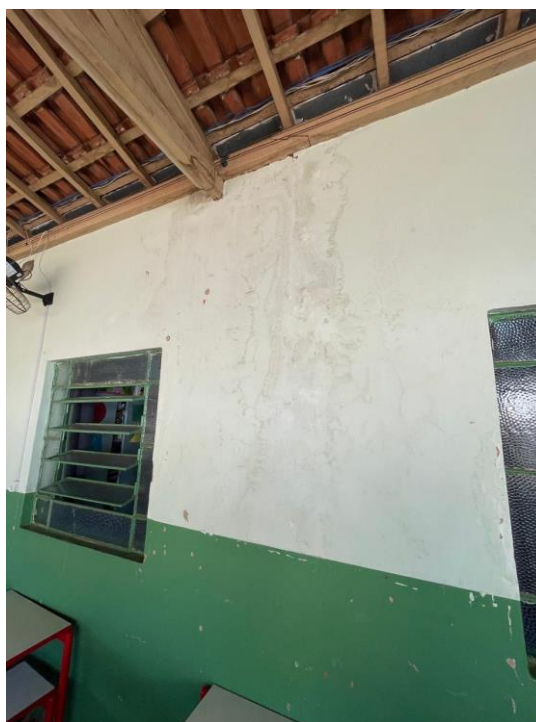
Figura 16 - Infiltrações em paredes e teto com vazamento em dias de chuva