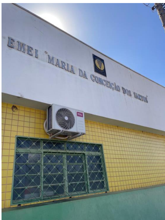
Figura 9 - Fachada

Destaque para o relatório de fotos abaixo: