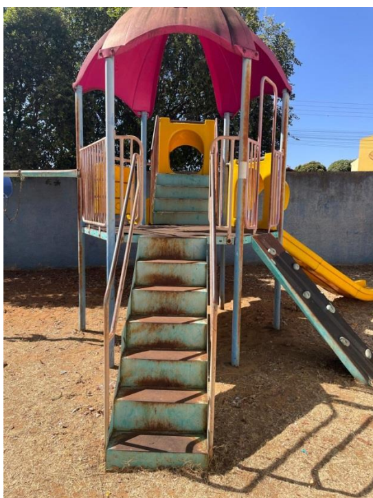
Figura 7 - Parque sem manutenção e impróprio para uso dos alunos