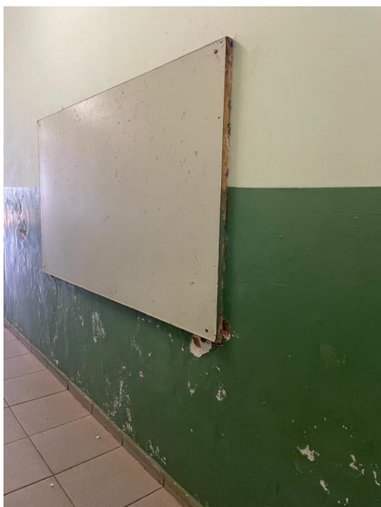
Figura 3 - Paredes com descascamento e desgaste