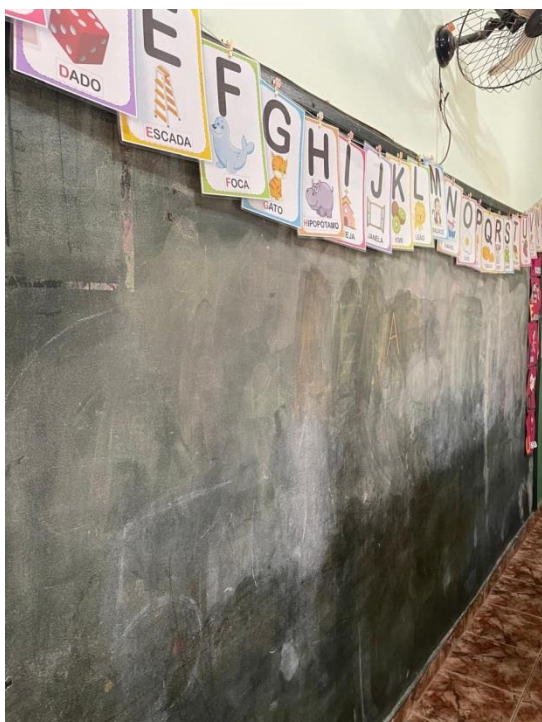
Figura 17 - Lousa deteriorada e imprópria para uso