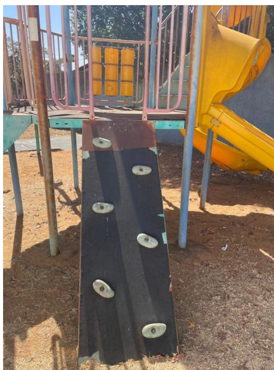
Figura 8 - Parque sem manutenção e impróprio para uso dos alunos