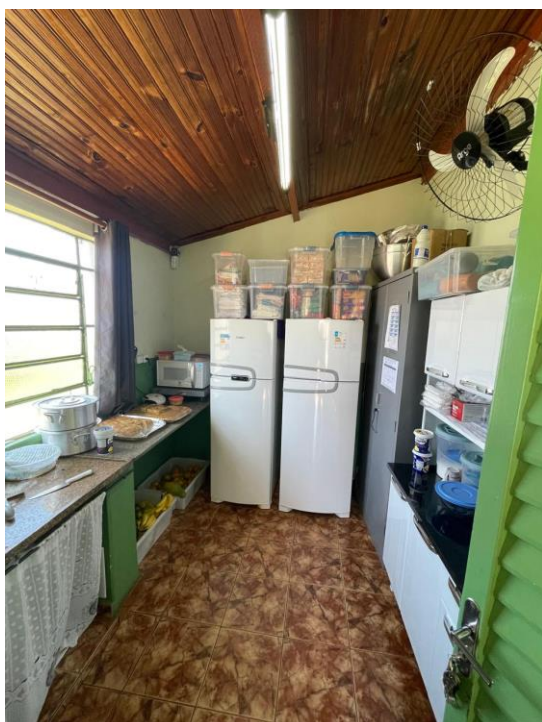
Figura 19 – Cozinha pequena e sem espaço para armazenamento de alimentos e materiais