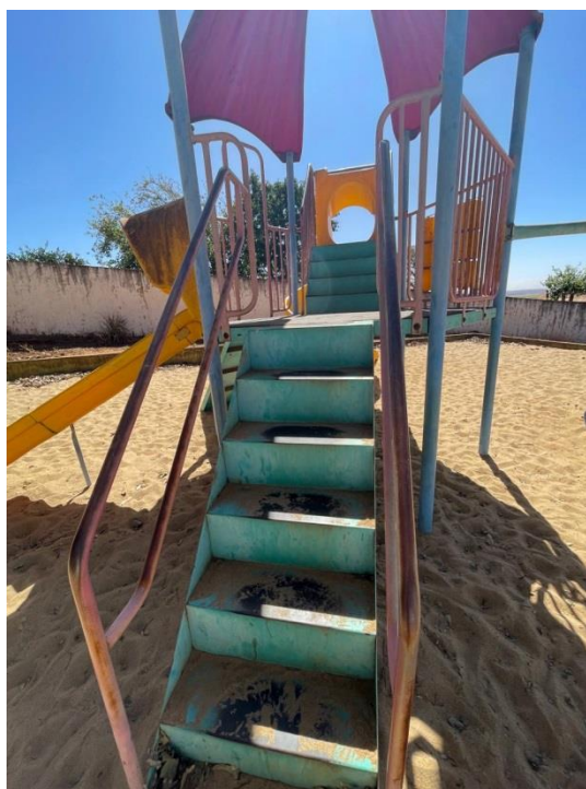
Figura 20 - Parque sem manutenção e impróprio para uso dos alunos