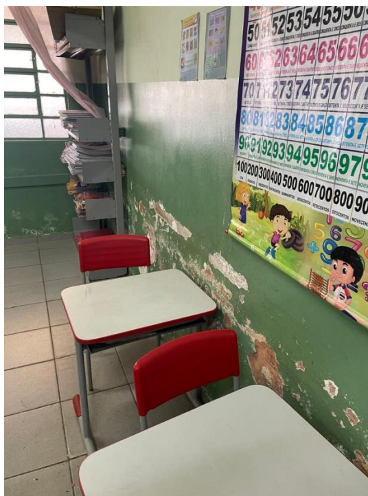
Figura 4 - Paredes com descascamento e desgaste