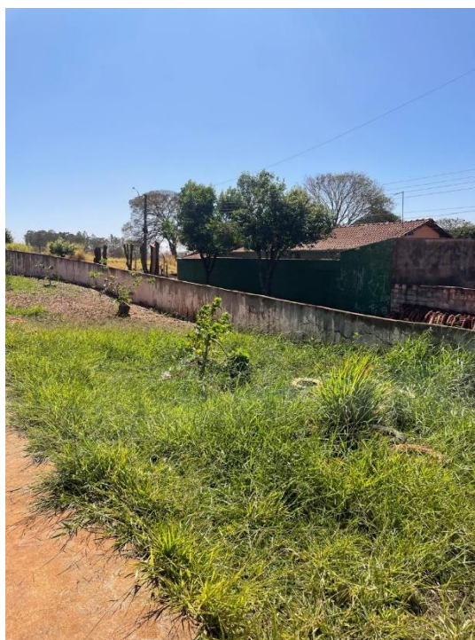
Figura 22 – Muros da área externa baixos e sem equipamentos de segurança