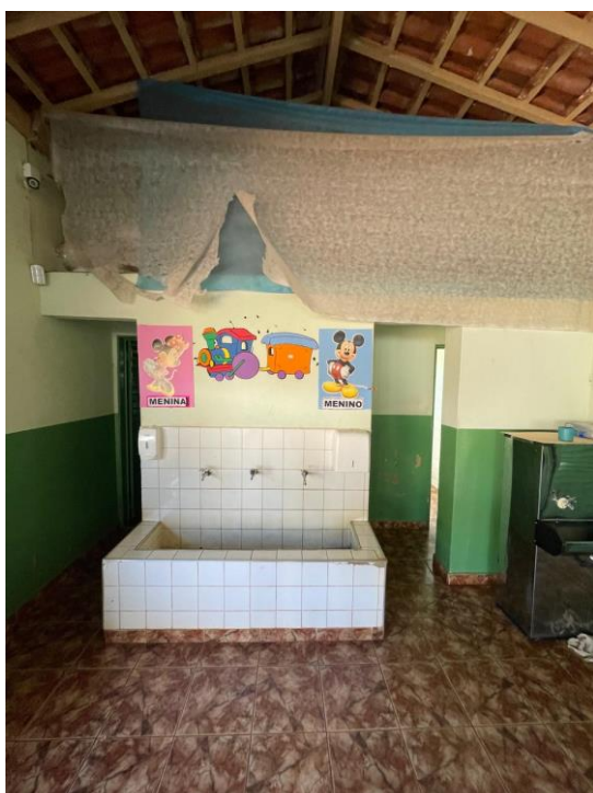
Figura 13 - Apenas um banheiro (individual) masculino e um banheiro (individual) feminino