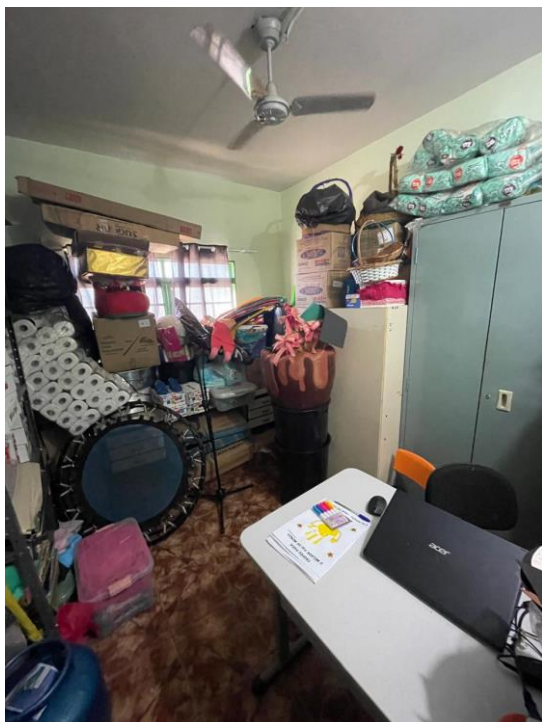
Figura 11 – Sala improvisada como almoxarifado