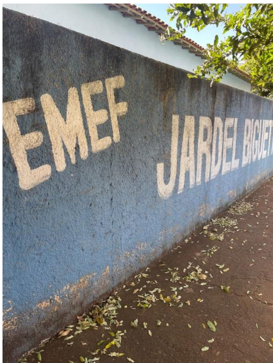
Figura 1 - Fachada