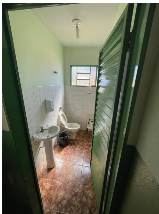
Figura 14 - Vasos sanitários com tamanhos impróprios para idade dos alunos