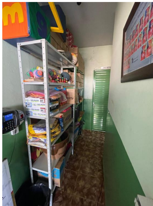
Figura 12 – Armários improvisados no corredor para guardar materiais de almoxarifado