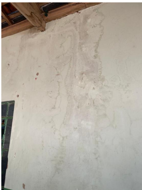
Figura 15 - Infiltrações em paredes e teto com vazamento em dias de chuva