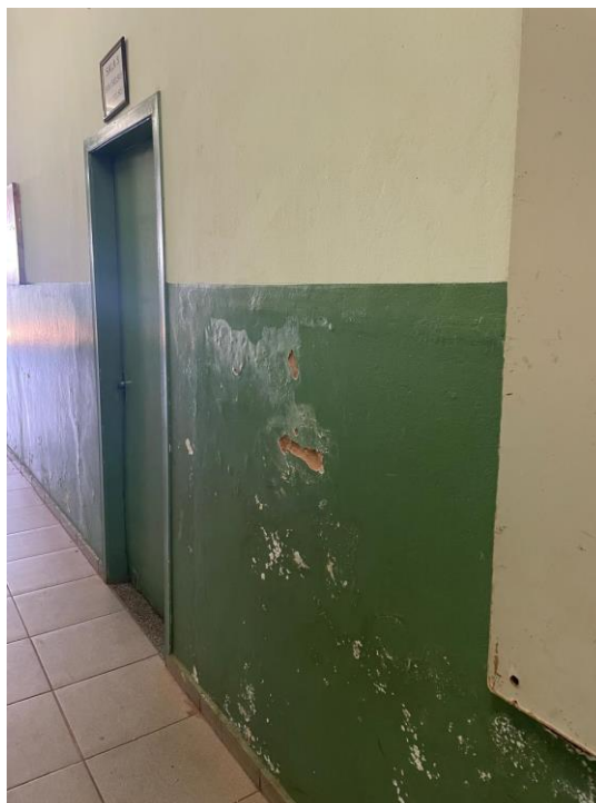
Figura 2 - Paredes com descascamento e desgaste