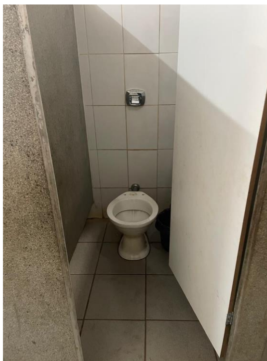
Figura 6 - Vaso sanitário sem assento e tempo